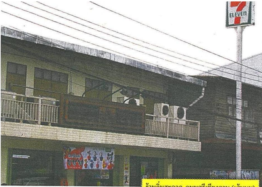
ร้านอิมสะดวก ถนนศรีเชียงใหม่ (เส้นบน)